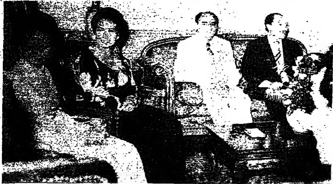
الرئيسان السادات وابتشيريا وعقباها ■

تحدث الرئيس السادات والبريطانيون والفرنسيون والاميركيون... في القاهرة - ا.س.م